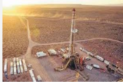
Petróleo y Gas